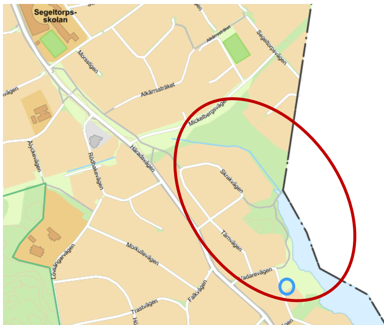
Figur 1. Översiktskarta där parkområdet är markerat med en röd cirkel. Lekplatsens läge är markerat med en blå cirkel.

Det råder brist på parker, lekplatser och bostadsnära natur i Segeltorp och en stor del av grönsstrukturen är privatägd mark. Därför finns ett stort behov av att utveckla befintliga grönområden för rekreation. Området pekades tidigare ut som framtida stadsdelspark i översiktsplanen och parkplanen, men då en bred ledningsrätt för Stockholm vatten och avfall (SVOA) går genom området längs Mickelsbergsvägen så kan inga fundament placeras inom en stor del av ytan. Det innebär att det inte går att placera en lekplats eller annan aktivitetsyta med utrustning som behöver förankras i mark här. Därför gjordes i programhandlingsskedet bedömningen att möjligheten att planera området som stadsdelspark inte var möjlig och lek- och aktivitetsytor vid Mickelsbergsvägen utgick.