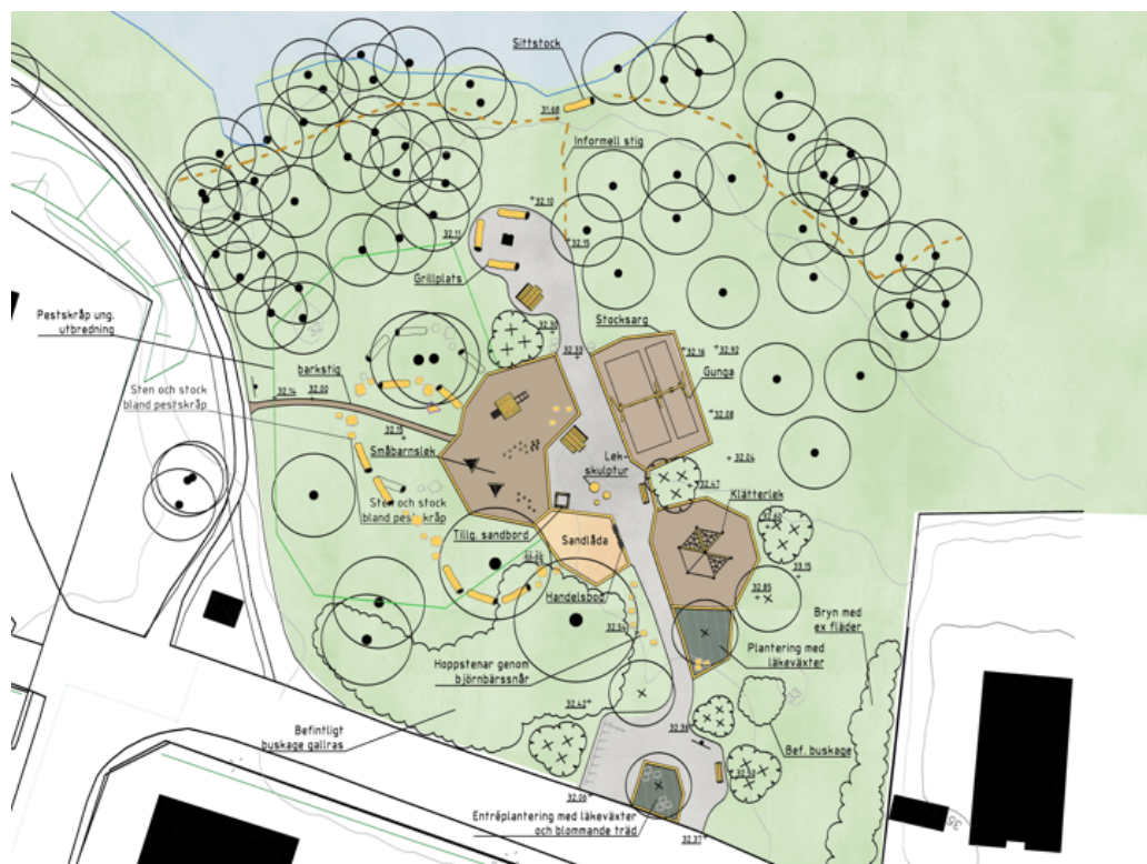
Figur 3. Skiss lekplats

områdeslekplats och riktar sig till barn i åldrarna 1-10 år, innehåller utrustning för klätter-, gung-, balans- och rollek. Tematiken kring lekplatsen hämtar inspiration från omgivande naturtyp, och lekmöjligheterna sprider sig med enkla tillägg ut i intilliggande natur. I anslutning till lekplatsen anläggs också en grillplats med sittplatser i ett attraktivt läge med utblick över sjön.